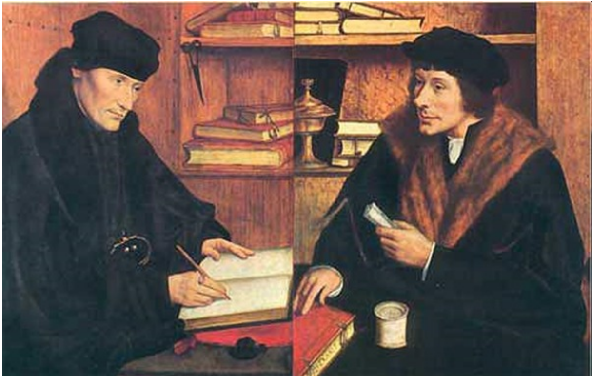
Desiderius Erasmus en Peter Gillis door Quinten Massijs